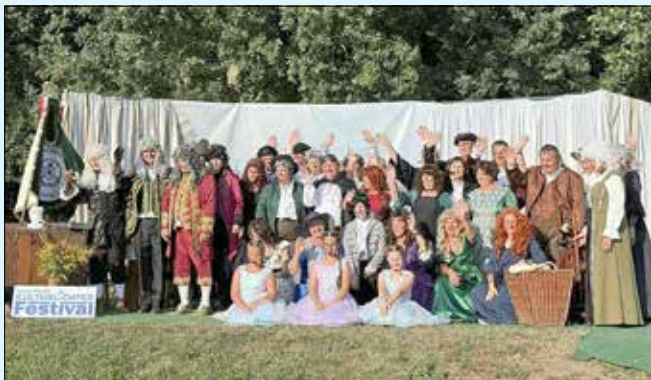
6. OpenAir-Theaterspektakel

Die Zusammenarbeit mit den vielen ehrenamtlichen Akteuren klappt derweil ebenfalls sehr gut. So fanden wie angekündigt im Rahmen des Kulturlichter-Festivals so einige Veranstaltungen statt. Dazu zählen das wieder wunderbar gelungene 6. OpenAir-Theaterspektakel unserer Röthaer Stadtraben oder auch die sehr sehenswerte Vernissage unserer Röthaer Montagsmaler – um nur zwei Beispiele zu nennen.