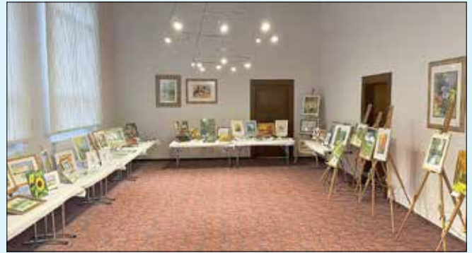
Vernissage Röthaer Montagsmaler

Auch der September startet mit reichlich Angeboten. Über den bundesweiten Tag des offenen Denkmals, dessen sächsisches Format in diesem Jahr hier bei uns in Rötha stattfindet, berichte ich Ihnen dann gerne im nächsten Amtsblatt. Sehen Sie wie immer gerne im Veranstaltungskalender weiter hinten im Amtsblatt oder auf unserer städtischen Internetseite nach den Angeboten. Neu – und ganz im Sinne einer weiteren Digitalisierung und besseren öffentlichen Sichtbarkeit – darf ich Ihnen einen Blick auf unsere digitale Infosteile auf dem Marktplatz ans Herz legen. Hier finden Sie nunmehr gebündelt viele Termine und Angebote, die bei uns in der Stadtverwaltung zusammenlaufen.